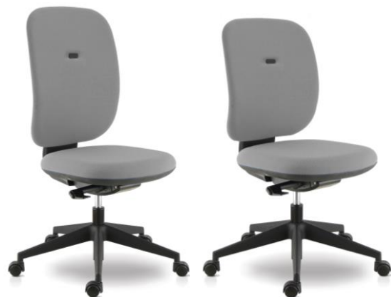
SY AUTO sans bras, dos Haut