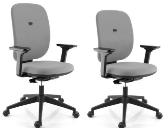
SY AUTO avec bras, dos Haut

Observations : Accotoirs 1D ou 3D ou sans.