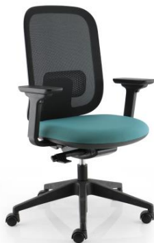
IR 86 / 5G