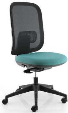
IR 66 / 0G

Observations : Accotoirs 1D (4G) ou 3D (5G) ou sans (0G).