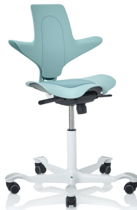
Design: Peter Opsvik. Modèle déposé et breveté