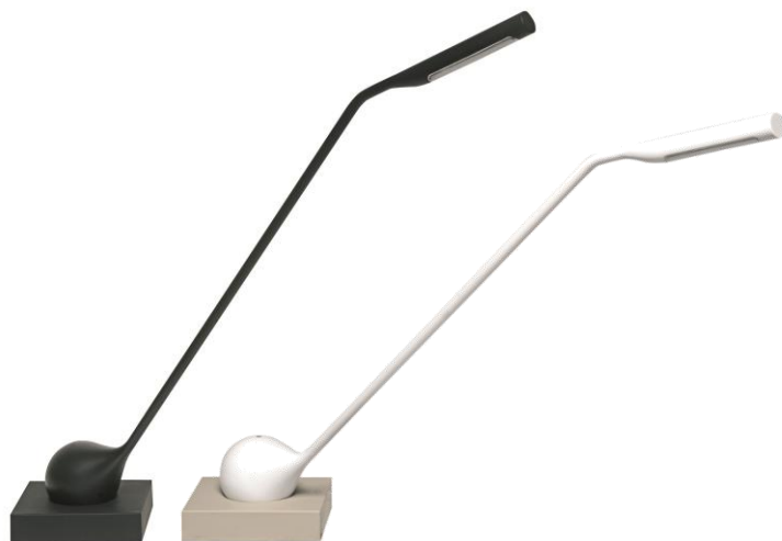
Réf. 100340539 – Noir Réf 100340537 - Blanc

Très belle lampe dessinée par Jean-Marie Massaud Pivote sur le socle à 340° et inclinaison du bras haut/bas Coupe automatique au bout de 5 heures sans utilisation