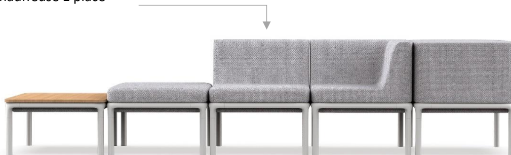
Chausseuse 1 place

La gamme complète Lotua se compose de chausseuses et poufs intégrant tables, tablettes, connectiques et cloisons.