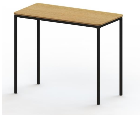
LT D R