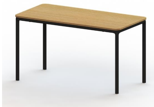
LT B R