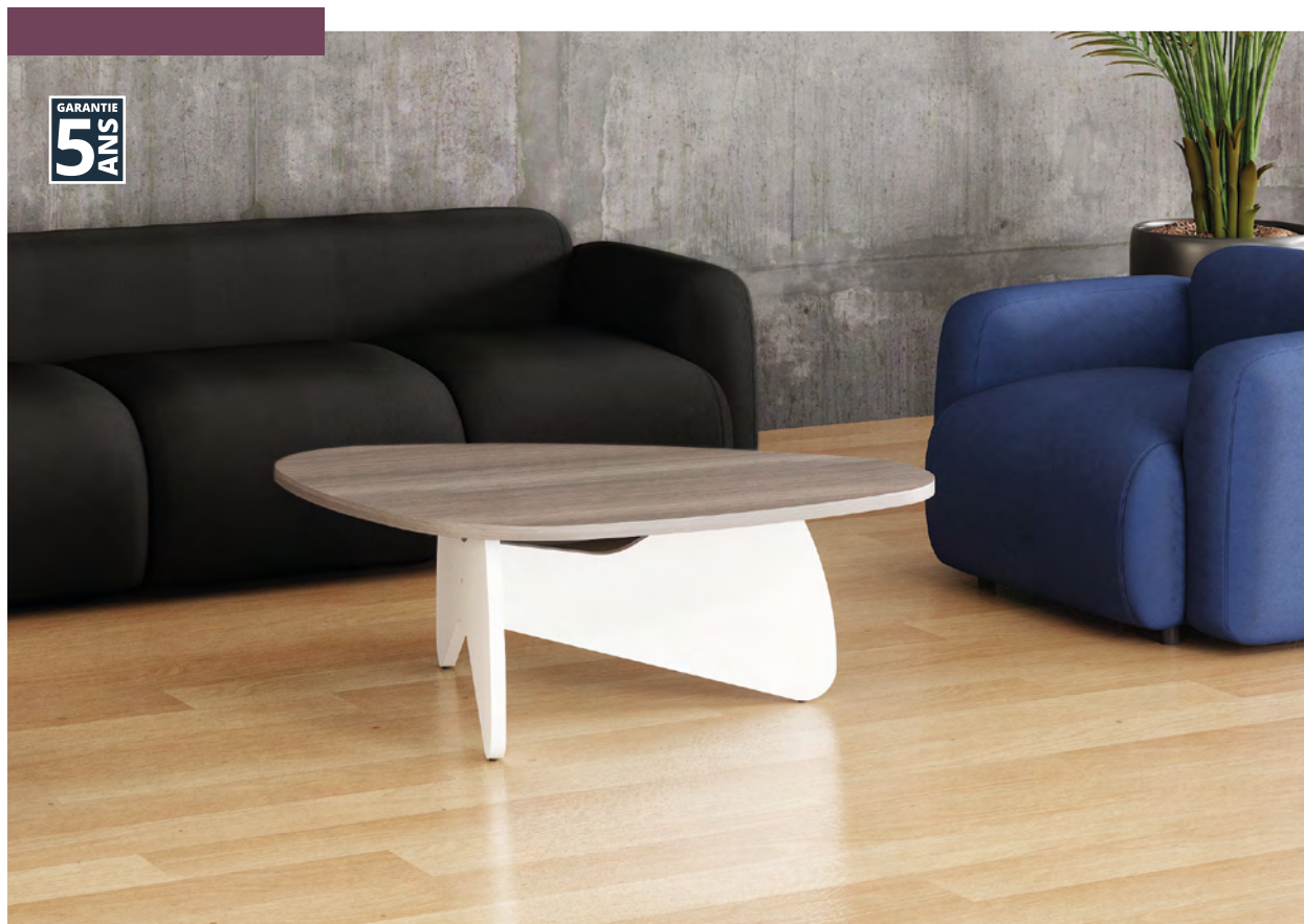
TABLE BASSE GALET