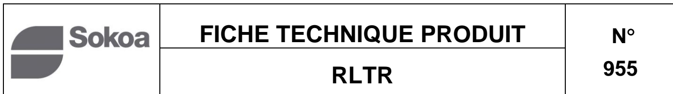
TABLE BASSE RECTANGULAIRE